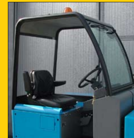
Cabina aperta con parabrezza e tergicristallo Open cab with wind screen and wiper