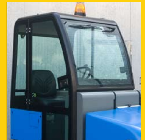
Cabina chiusa All-weather cab