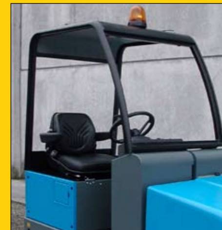
Cabina aperta Open cab